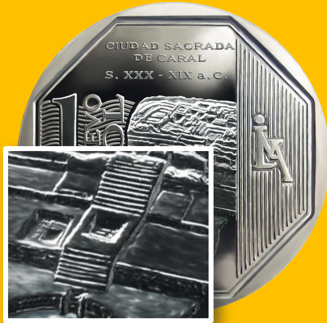
Detalle de la Ciudad Sagrada.