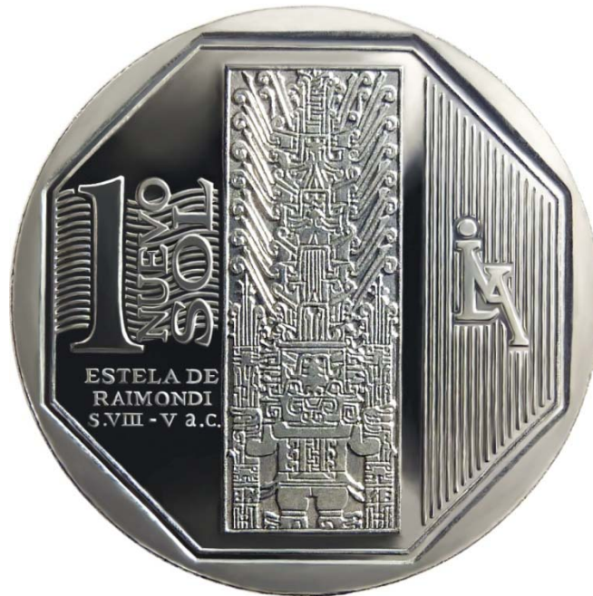
ESTELA DE RAIMONDI