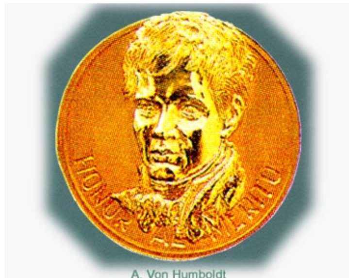
A. Von Humboldt