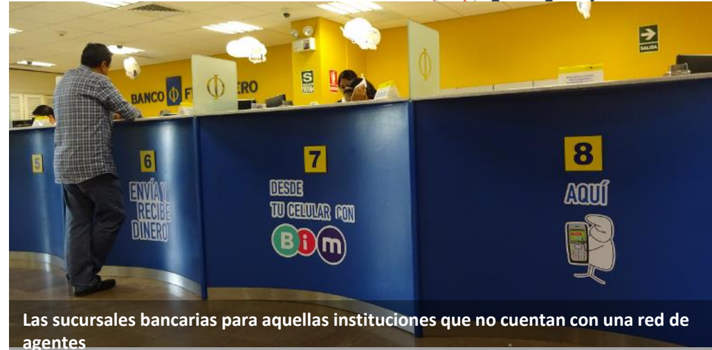
Las sucursales bancarias para aquellas instituciones que no cuentan con una red de agentes