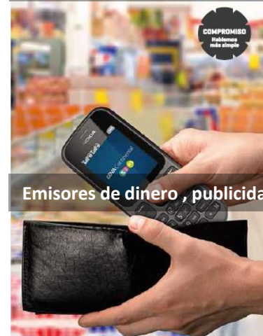
Emisores de dinero, publicidad para los usuarios finales