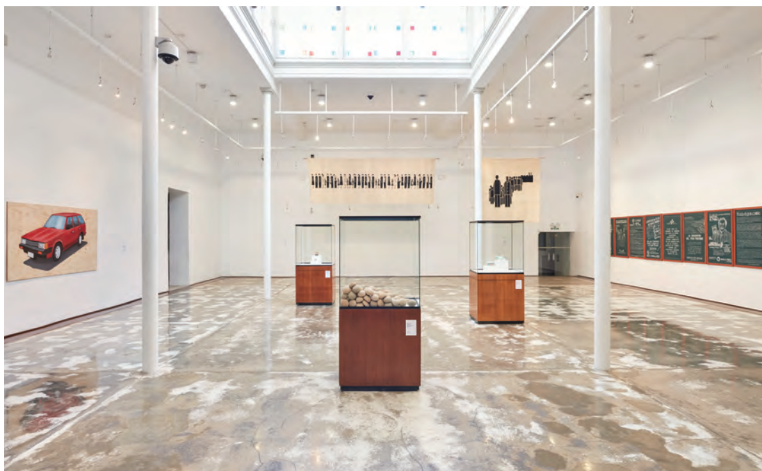
VISTA GENERAL DE LA EXPOSICIÓN.

“ Uno de los pilares de la gestión del Museo Central es el enfoque educativo que nos ha permitido crear puentes con la ciudadanía, así como generar espacios de diálogo intergeneracional. ”