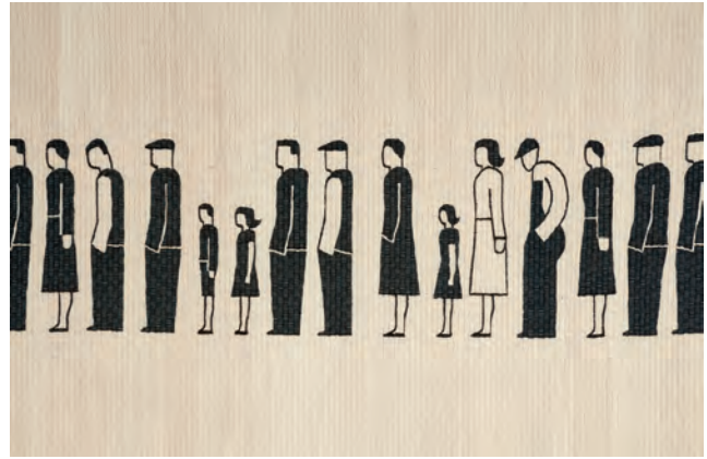
DETALLE DE IMAGINARIOS DEL SUBDESARROLLO: COLA. 2017. TEJIDO EN LANA DE OVEJA 145 X 445 CM

y el arte textil como un símbolo de esperanza por lo nuestro.