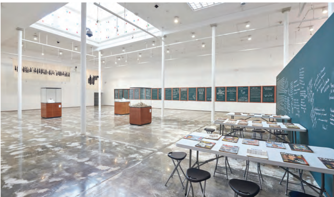
ÁREA DE CONSULTA DE ARCHIVO DOCUMENTAL/PIZARRA.

Estas experiencias nos sirven para mostrar cómo el arte contemporáneo puede servir como baluarte para la memoria y tiene el poder de transformar, de impactar y de inspirar a las demás personas. La diversidad de estos mensajes, sumados a las conversaciones sostenidas con los más de once mil asistentes a la muestra, nos invitan a continuar forjando un Museo Central que se relacione con las vidas de las personas, además de seguir creando estos puentes que y entablando estas conversaciones que nos convierten en un espacio de y para la ciudadanía.