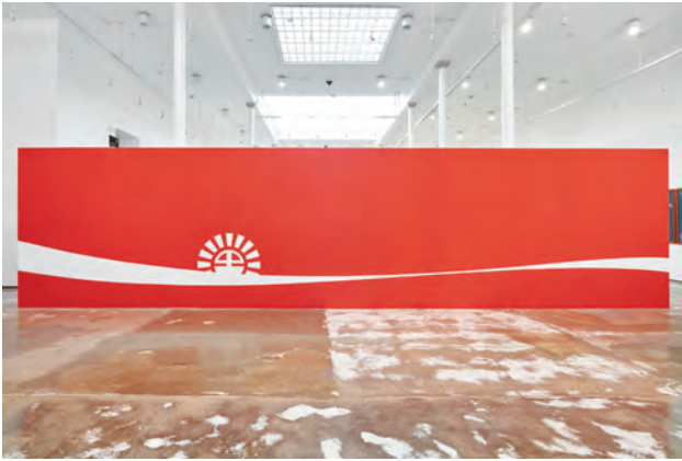
SUNSET 2018. PINTURA LÁTEX SOBRE PARED 250 X 1000 CM