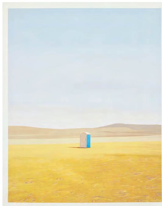
BIRÚ, MIENTRAS RECORRÍA EL DESIERTO CON ANDAR ERRANTE EN AQUEL OTOÑO QUE SE TOPÓ CON UNA LETRINA. POR POCO NO ENTRÓ EN ELLA. MIGUEL ÁNGEL AGUIRRE VEGA. LIMA 1973 ÓLEO SOBRE TELA 162 X 130 CM

Uno de los pilares de la gestión del Museo Central es el enfoque educativo que nos ha permitido crear puentes con la ciudadanía, así como generar espacios de diálogo intergeneracional. Por este motivo, el artista propuso realizar “ Media cajetilla de cigarrillos y una de fósforos ” en el MUCEN pues consideraba que en este espacio podría llegar a diversos públicos y especialmente a los escolares. Para él era “necesario mostrarles una parte de nuestra historia reciente, algo olvidada o dejada de lado”.