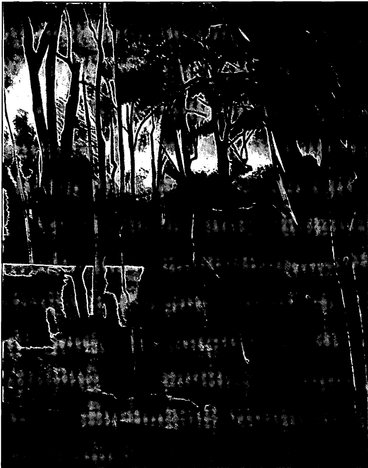
PAISAJE BRETAÑA, MICHEL GRAU MUSEO DEL BANCO CENTRAL DE RESERVA DEL PERU