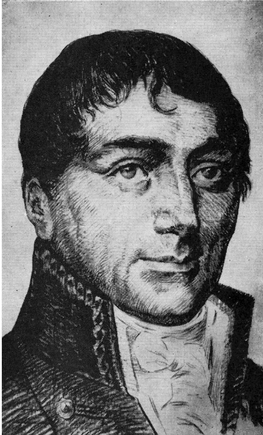
Doctor HIPÓLITO UNANUE Ministro de Hacienda de San Martín