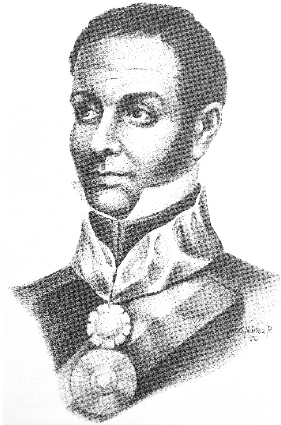
Coronel JOSÉ DE LA RIVA AGÜERO