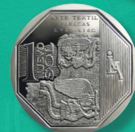
Arte textil Paracas