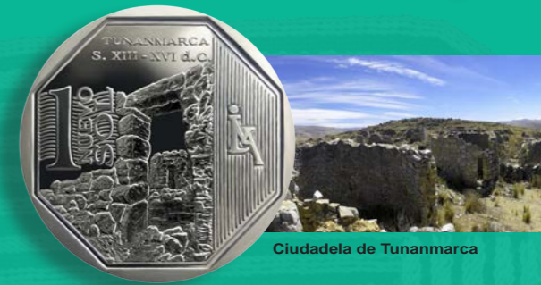
Ciudadela de Tunanmarca