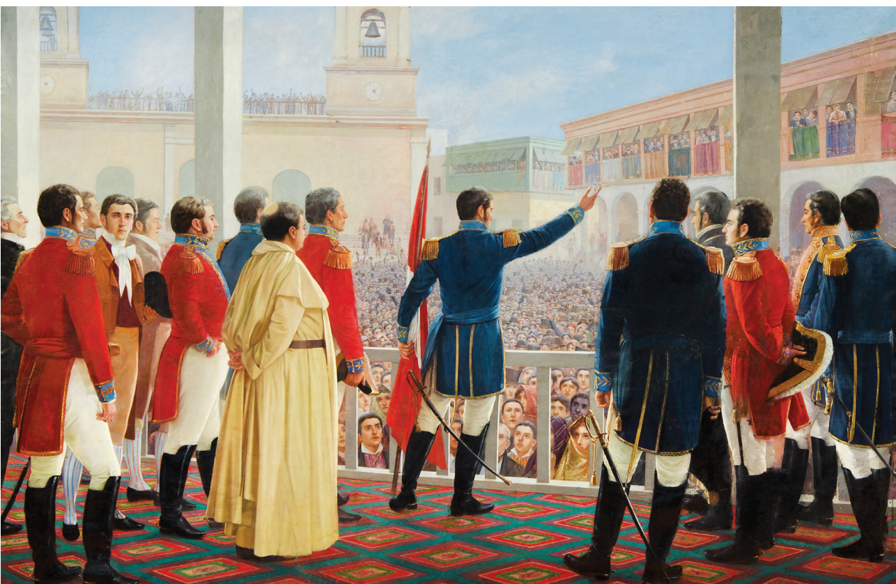
Proclamación de la independencia del Perú (1904). Óleo de Juan B. Lepiani. Colección del MNAHP.

las jóvenes repúblicas sudamericanas. Esta situación, que nos condujo a un proceso de militarización acelerada (hecho que fue en detrimento de nuestra institucionalidad), nos dota, paradójicamente, de una historia única por su complejidad y dramatismo. El último bastión del Imperio español en Sudamérica tiene la capacidad de convertirse en el espacio donde se discuta en profundidad el alto precio que los pueblos deben de pagar para obtener ese bien supremo llamado libertad.