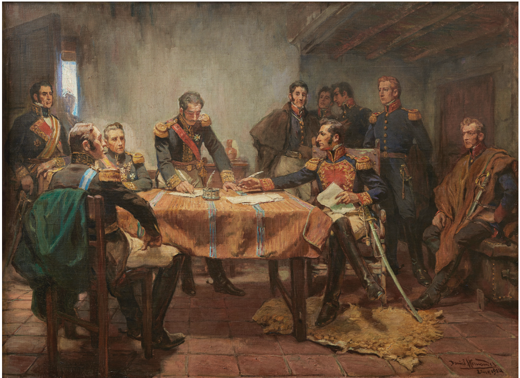
Capitulación de Ayacucho (1924). Óleo de Daniel Hernández.

José de la Mar, podemos regresar al punto inicial de una apuesta política que no fue fácil. Lo que propone esta colección numismática —que recogerá acontecimientos históricos fundamentales, como la revolución del Cusco de 1814, la proclamación de la independencia y la instalación del primer Congreso Constituyente en 1822, en una serie complementaria— es un ejercicio de biografía personal y colectiva sobre el difícil camino hacia la libertad. Proceso que culminó en la Pampa de la Quinua, un lugar donde las armas consolidaron lo que las palabras intentaron promover en nuestra primera constitución de corte liberal.