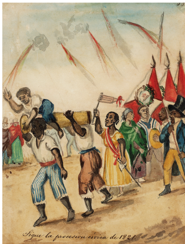
Sigue la procesión cívica de 1821 (S. XIX). Acuarela de Pancho Fierro. Pinacoteca Municipal Ignacio Merino. Municipalidad de Lima.

La exhibición de coraje y valentía de las Toledo y el pueblo de Concepción ocurrió entre marzo y abril de 1821; la fecha no está del todo corroborada. Después de varias cargas de fusilería, de una orilla a la otra, y ante el avance de las fuerzas españolas que iniciaban ya el cruce del río Mantaro, las Toledo, encabezando a los defensores de Concepción, lograron cortar las amarras del puente colgante. Este acto temerario fue ejecutado en medio del fuego enemigo, con una rapidez que hasta hoy sorprende. Los soldados realistas que temerariamente avanzaban ya por el puente se hundieron y algunos probablemente se ahogaron en las tumultuosas aguas del Mantaro. Con esta notable acción de la sociedad civil, los pa-