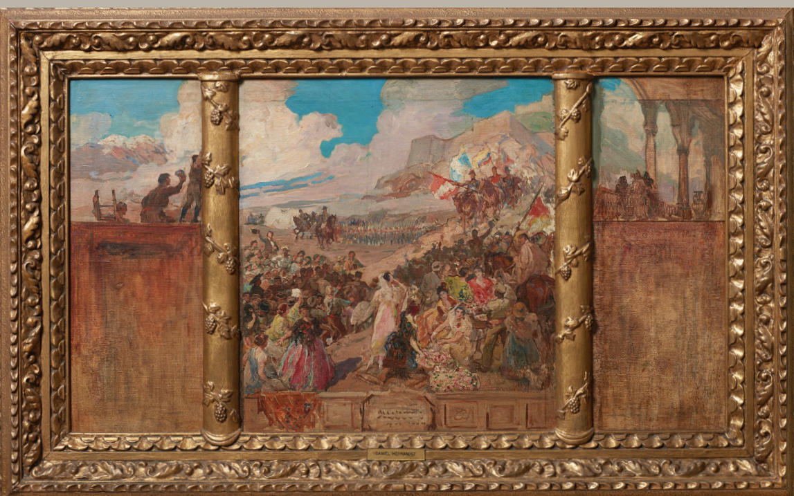
Paso de los libertadores (1924). Óleo de Daniel Hernández. Colección BCRP.

los trabajos de Sánchez Carrión con los de Luna Pizarro, queda claro que, para el antiguo abogado de los pobres, la inclusión del indígena era un objetivo que no se hace tan evidente en Luna Pizarro, cuya labor se centró en defender el balance de poderes, base fundamental de cualquier república en forma. Cabe recordar que el sacerdote arequipeño defendió la preeminencia del bien público sobre los intereses personales.