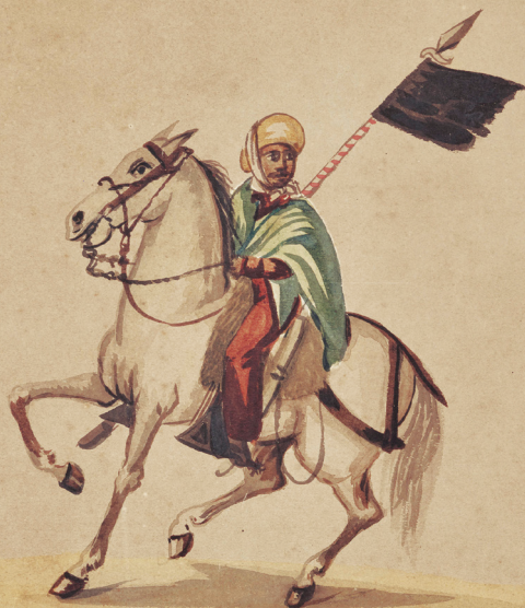
El montonero (S. XIX). Acuarela de Pancho Fierro. Colección BCRP.