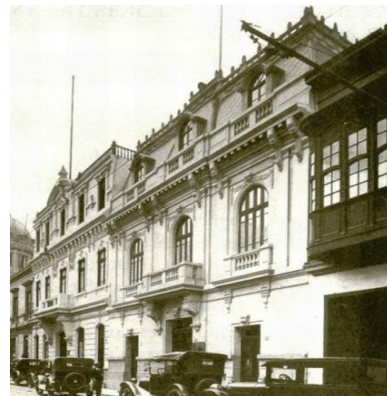
Fachada del Banco de Reserva del Perú, 1922

El primer local que ocupó el Banco de Reserva fue el de las instalaciones de la Junta de Vigilancia de Cheques Circulares en la cuadra 2 del Jirón Miroquesada.