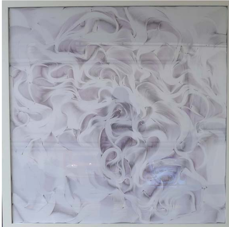
“Sin título” de Kenji Nakama Miyashiro