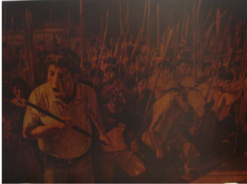
"Los días oscuros nos han encontrado" de Milko Torres Torres