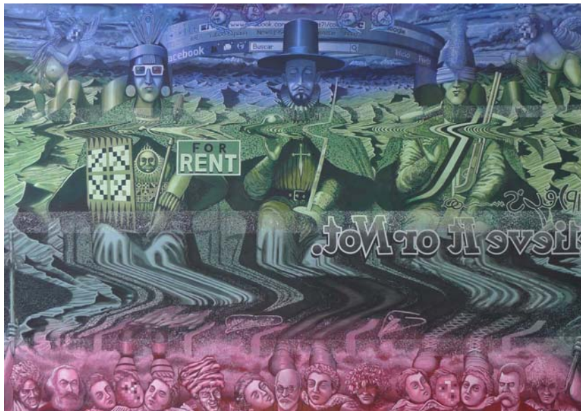
“No hay peor ciego” de Ángel Valdez Rosales