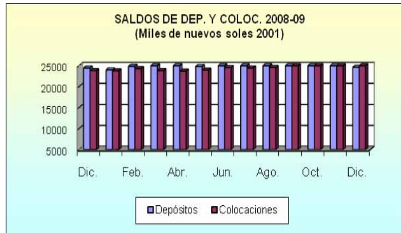
GRAFICO N° 01

La cartera pesada del sistema financiero promedió 2,5 por ciento, con un crecimiento de 0,2 puntos.