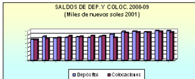
Gráfico N° 02

La cartera pesada del sistema financiero promedió 2,1 por ciento, tasa inferior en 0,1 puntos a la registrada en marzo de 2008.