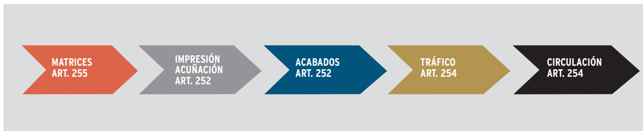
DIAGRAMA 2 ■ Las fases de la falsificación de numerario

Banco de España, en lo que se refiere a los Euros. Se mantiene intercambio de información sobre falsificación con bancos centrales y operadores de justicia de varios países, principalmente, latinoamericanos. Asimismo, funcionarios de los bancos centrales de Bolivia, Chile, Paraguay, Uruguay y Nicaragua han realizado pasantías en la OCN.