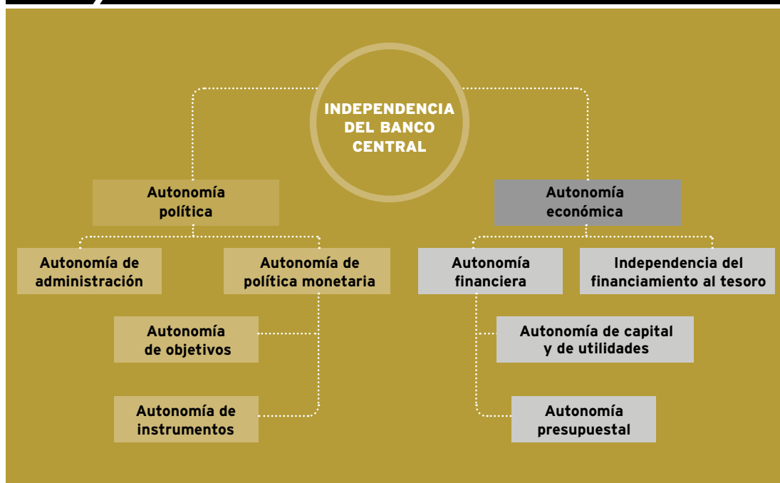
GRÁFICO 2 | Independencia del Banco Central

principio de la estabilidad de precios como único objetivo, basado en la independencia del gobierno.