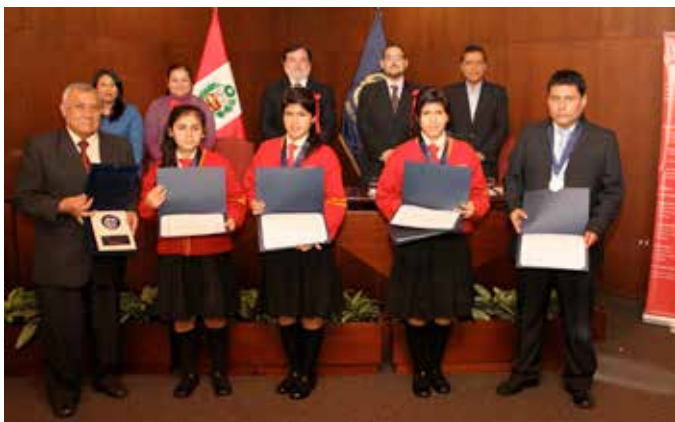
COLEGIO JUAN CRONIQUEUR DE EL AGUSTINO OBTUVO EL SEGUNDO LUGAR