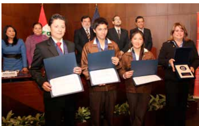
COLEGIO NUESTRA SEÑORA DEL CARMEN - CARMELITAS DE MIRAFLORES OBTUVO EL TERCER LUGAR