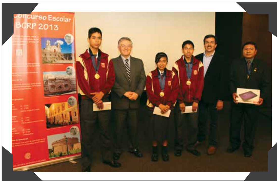
ALUMNOS DE PIURA GANADORES DEL CONCURSO ESCOLAR 2013

En el trabajo, desarrollado por los jóvenes de Paíta, se indica que el mercado de capitales es un mecanismo importante porque ayuda a las personas que tienen buenos proyectos o ideas