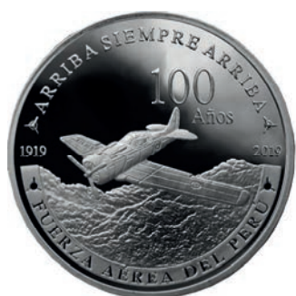
100 años de la Fuerza Aérea del Perú

Durante el año, se emitieron tres monedas conmemorativas de plata. En enero se puso en circulación la moneda alusiva a los 100 años de la Fuerza Aérea del Perú; en setiembre, la moneda relacionada a los 250 años del nacimiento de Alexander von Humboldt; y en octubre, la moneda alusiva al centenario del fallecimiento de Ricardo Palma.