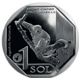
Mono Choro Cola Amarilla

Con la emisión de las tres últimas monedas en 2019, concluyó la serie denominada “Fauna Silvestre Amenazada del Perú”. Sus diseños fueron el Mono Choro Cola Amarilla, el Gato Andino y la Rana Gigante del Titicaca. Esta serie conformada por 10 monedas, se orientó a que, a través de un medio de pago de uso masivo, se genere conciencia sobre la importancia de la preservación de las especies de nuestro entorno y el cuidado del medio ambiente, impulsando a la vez la cultura numismática en nuestro país.