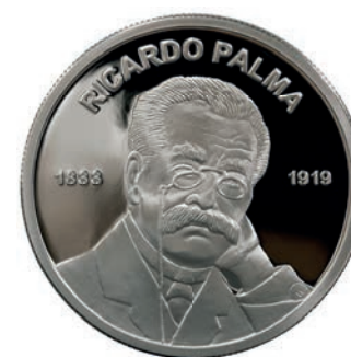
Centenario del fallecimiento de Ricardo Palma

El Banco Central dispuso el retiro de circulación de las monedas de S/ 0,05 a partir de enero de 2019. Dichas monedas ya no pueden ser usadas como medio de pago y solo pueden ser canjeadas por su valor nominal, en múltiplos de S/ 0,10 por un plazo ilimitado en las oficinas del BCRP o en las empresas del sistema financiero (ESF).