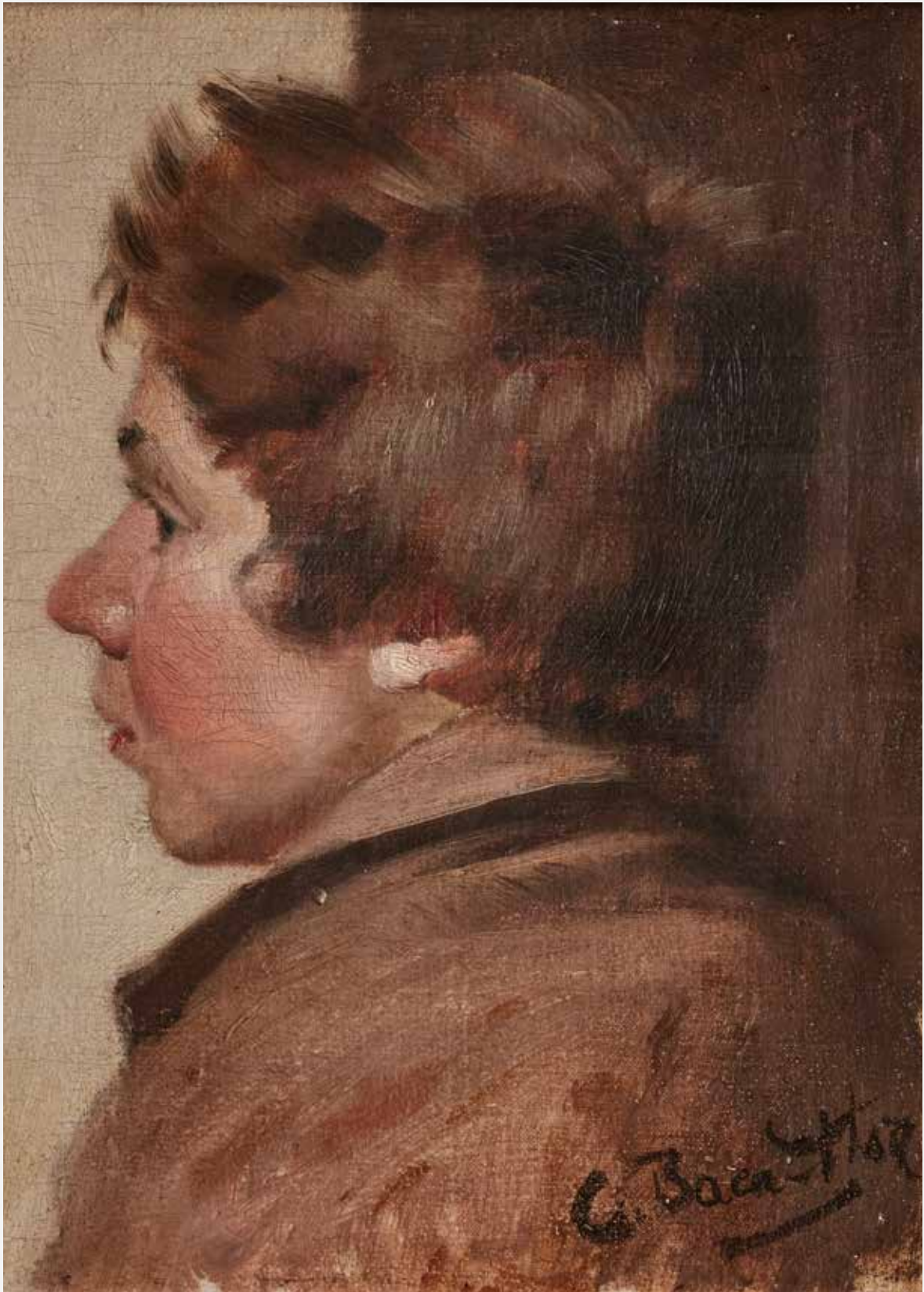
Carlos Baca Flor Perfil de niño