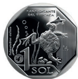
Rana Gigante del Titicaca

Durante el año, se emitieron tres monedas conmemorativas de plata. En enero se puso en circulación la moneda alusiva a los 100 años de la Fuerza Aérea del Perú; en setiembre, la moneda relacionada a los 250 años del nacimiento de Alexander von Humboldt; y en octubre, la moneda alusiva al centenario del fallecimiento de Ricardo Palma.