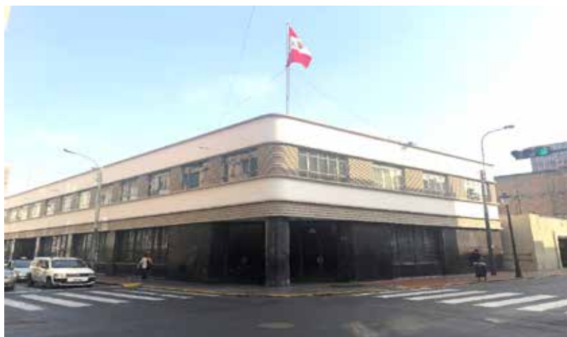
Nuevo local de la Biblioteca del BCRP

Por otro lado, la Biblioteca adquirió mediante compras, canjes y donaciones 3 749 libros y publicaciones periódicas relacionados a política monetaria y económica, finanzas internacionales, comercio y sector externo, finanzas públicas y teoría económica, entre otros.