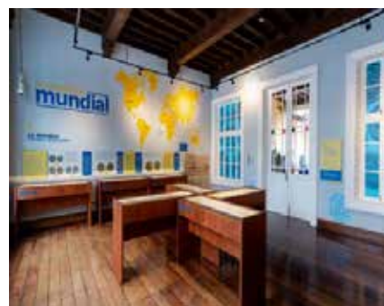
Sala de Numismática Mundial

En 2019 el MUCEN destacó por el préstamo de 20 piezas de arte precolombino que fueron trasladadas a China para la exposición itinerante “Antigua Civilización de los Andes. Iluminando los Orígenes del Imperio Incaico” . Asimismo, facilitó al Museo Nacional de Colombia, la obra “Retrato de Lorenzo del