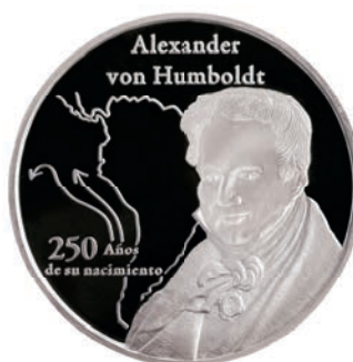
250 años del nacimiento de Alexander von Humboldt