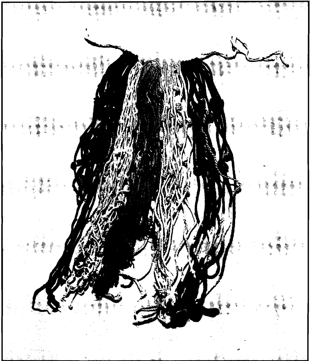
QUIPU INCA 1440 - 1532 d.C. Museo del Banco Central de Reserva del Perú