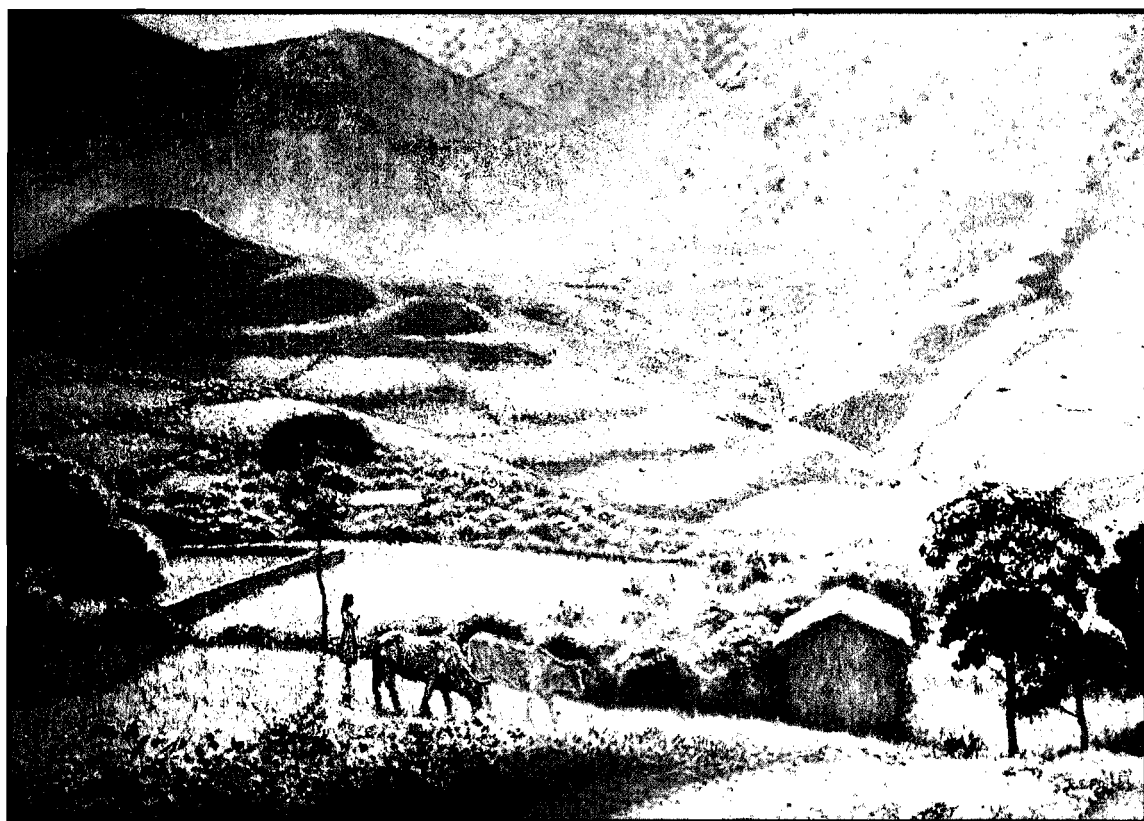
PANORAMA DE ARMATANGA - Ricardo E. Flórez Museo del Banco Central de Reserva del Perú