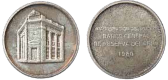
Medalla "Inauguración del Museo BCRP", plata, 1980.

En 1965 se acuñó una serie de monedas conmemorativas al cuatricentenario de la fundación de la Casa de Moneda de