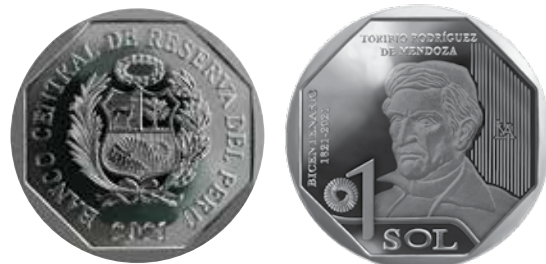
1 sol, alpaca, 2021. Toribio Rodríguez de Mendoza – Constructores de la República.