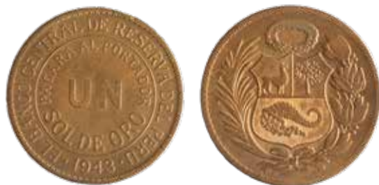
1 sol de oro, 1943, latón.

tema económico financiero peruano y fortalecer la estabilidad monetaria del país, el 18 de abril de 1931 se creó el Banco Central de Reserva del Perú (BCRP) mediante la Ley 7137, en reemplazo del BRP, encaminando así al país en la historia moderna de la banca central. Asimismo se estableció al sol de oro como la nueva unidad monetaria (Decreto Ley 7125).