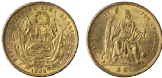
8 escudos, Lima, 1863.

En la etapa temprana de la República, en Perú existieron varias casas de moneda. Estas fueron la ceca de Lima —que acuñó plata (1825-1856) y oro (1826-1856)—, de Cusco —que acuñó también oro (1826-1845) y plata (1826-1841)—, de Pasco —que acuñó plata (1836, 1843-1845 y 1855-1857)— y de Arequipa —que acuñó piezas de plata (1836-1841)—.