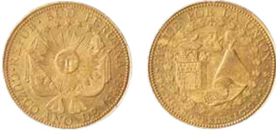
8 escudos, República Sud Peruana, Cusco, 1838.