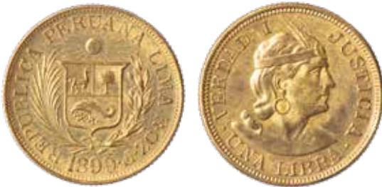
Una libra, Lima, 1899.