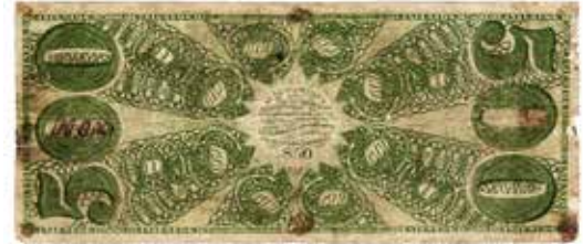
500 pesos, Banco del Perú, 1867.