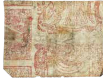
1 peso, 1822.