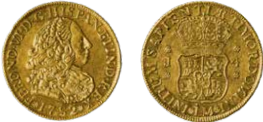
Pelucona: 4 escudos, Lima, 1752.