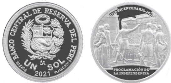
1 sol, plata, 2021. Bicentenario de la proclamación de la independencia.