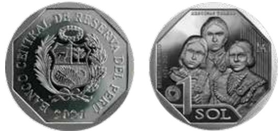
1 sol, alpaca, 2020. Heroínas Toledo – La Mujer en el Proceso de Independencia del Perú.