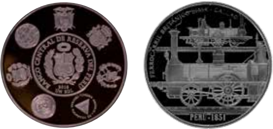
Un sol, plata, 2020. Ferrocarril británico Lima-Callao; pieza conmemorativa al primer ferrocarril del Perú.