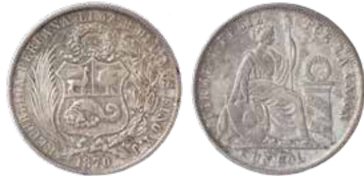
Un sol de 9 décimos, Lima, 1870.