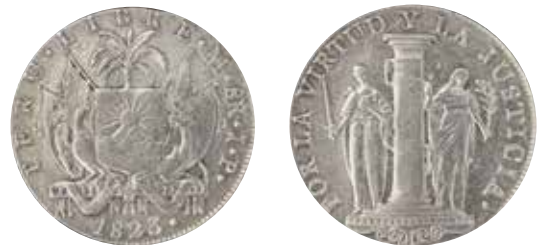
1 peso de San Martín: 8 reales, Lima, 1823.