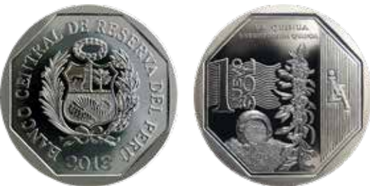
Un nuevo sol, alpaca, 2013. La quinua – Recursos Naturales del Perú.

Lima, acuñadas en oro, plata y latón, con el nombre Banco Central de Reserva del Perú, el mismo que, a partir de dicho año, perdura hasta la actualidad en las emisiones del BCRP. Al año siguiente (1966) se emitió otra serie conmemorativa por el centenario del Combate del 2 de Mayo de 1866. En 1971, por el sesquicentenario de la independencia del Perú se acuñaron nuevamente monedas conmemorativas. En líneas generales, la costumbre de acuñar estas monedas fue creciendo y fomentando el coleccionismo y la cultura numismática en nuestro país. Las piezas conmemorativas fueron acuñadas principalmente en oro y plata.