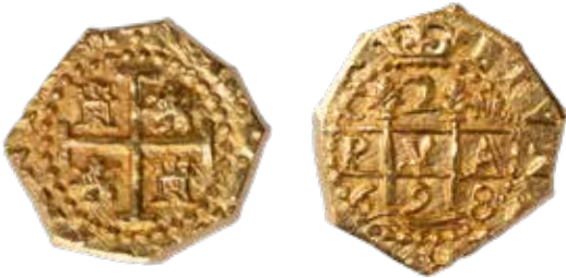
2 escudos, Cusco, 1698.