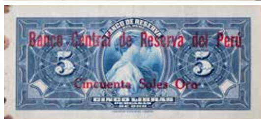
5 libras peruanas de oro (1922), resellado en 1931.