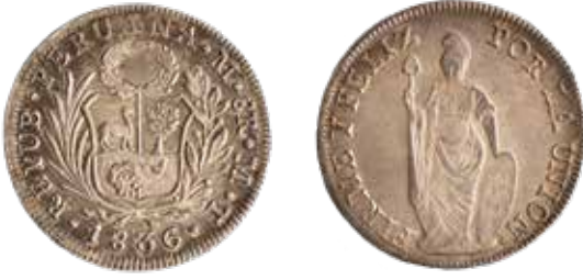
8 reales, Lima, 1836.