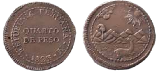
Un cuarto de peso, Lima, 1823.