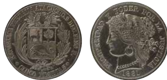
5 pesetas, Ayacucho, 1881.