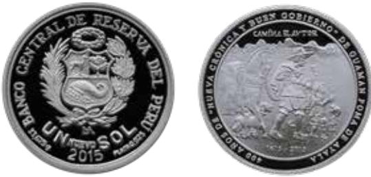
Un nuevo sol, plata, 2015. 400 años de “Nueva Crónica y Buen Gobierno” de Guamán Poma de Ayala.