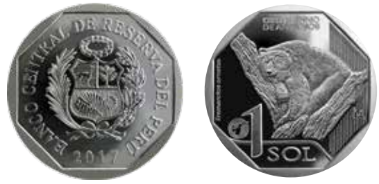
Un sol, alpaca, 2017. Oso de anteojos – Fauna Silvestre Amenazada del Perú.

En simultáneo, en estos años el Banco Central ha realizado varios seminarios sobre numismática con apoyo de la Sociedad Numismática del Perú y firmó un convenio de comodato con dicha institución, que permitió que desde el 2015 se volviera a exhibir la colección que conformó el primer Museo Numismático del Perú. En este