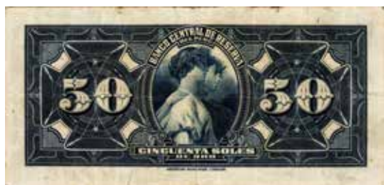
50 soles de oro, 1933.