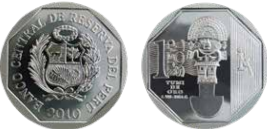
1 nuevo sol, alpaca, 2010. Tumi de oro – Riqueza y Orgullo del Perú.