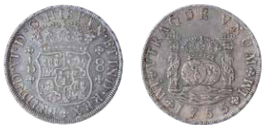
Columnaria: 8 reales, Lima, 1755.