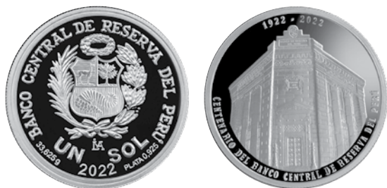
1 sol, plata, 2022. Centenario del Banco Central de Reserva del Perú.