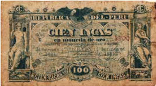
100 incas, República del Perú, 1881.