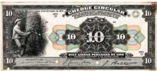
Espécimen de cheque circular: 10 libras peruanas de oro, 1914.

En 1885 la crisis derivada de la Guerra del Pacífico obligó a abrir cecas para la emisión de fraccionado en provincias. Así, Arequipa acuñó dineros y \frac{1}{5} de sol (1885); y Cusco, \frac{1}{2} dinero (1885) y dineros (1886). Después de este episodio, la Casa de Moneda de Lima quedó como la única fábrica de producción de monedas hasta el presente.