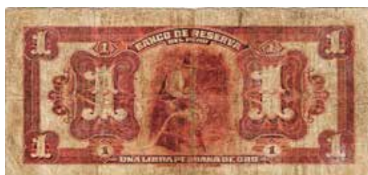
1 libra peruana de oro, 1922.