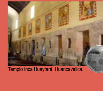
Templo Inca Huaytará, Huancavelica.