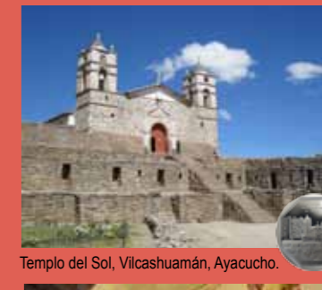
Templo del Sol, Vilcashuamán, Ayacucho.