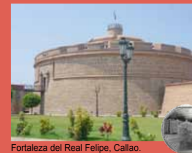
Fortaleza del Real Felipe, Callao.