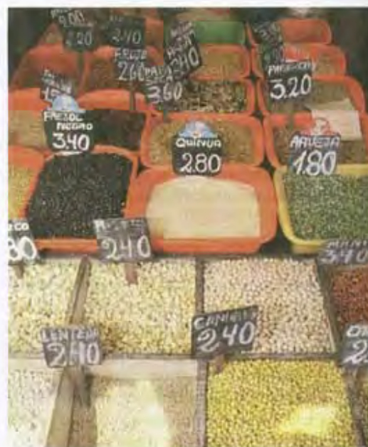
Una de las funciones principales del dinero es la de servir de unidad de cuenta para expresar los precios de los bienes y servicios.

c) Depósito de valor. El dinero también es utilizado como depósito de valor. Es decir, el dinero puede ser guardado y utilizado en compras futuras. Esto no ocurre en una economía de trueque, porque, por ejemplo, si alguien intercambia una camisa por 15 kilos de tomates, después de un mes esos tomates no podrían ser utilizados porque estarían descompuestos. Sin embargo, el dinero cumple esta función con ciertas limitaciones, porque puede perder valor por efecto de la inflación, pero aun así es superior al trueque.