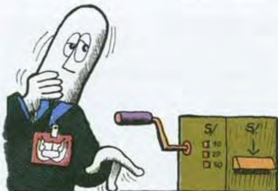
Cuando el Estado gasta más de lo que tiene, existe la tentación de cubrir su déficit emitiendo más dinero.

El déficit fiscal sostenido y su financiamiento a través de emisión inorgánica han sido motivo de muchos procesos inflacionarios y de todas las hiperinflaciones de la historia moderna.