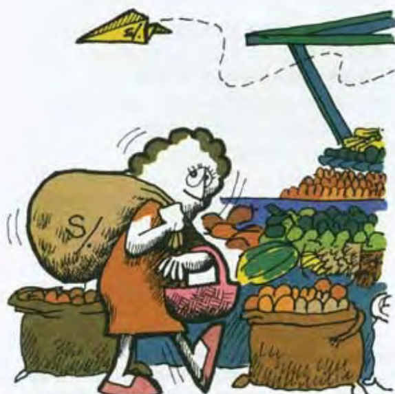
En un proceso de muy alta inflación el dinero va perdiendo valor rápidamente.

Durante un proceso inflacionario, se da una reducción de la capacidad de compra, es decir, del salario real de los trabajadores. Esto se debe a que los salarios de la mayoría de las personas aumentan en menor proporción que los precios.