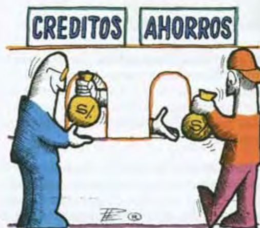
Los bancos crean dinero al prestar el dinero que reciben de los ahorristas.

Como ves, los billetes dan muchas vueltas. A través de los bancos, el dinero que tenía Andrés se ha multiplicado, y ha permitido que Berta y Carlos también tengan dinero. Y eso que no seguimos con el ejemplo, porque hubiéramos llegado a muchas más personas. Cuando el BCR pone un billete en circulación, el efecto sobre la cantidad de dinero disponible en la economía es mucho mayor por el efecto multiplicador que generan los bancos.