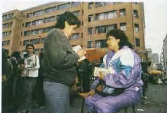
En un proceso inflacionario, una forma de protegerse de la inflación es comprando dólares.

También es importante que durante un proceso inflacionario nos preocupemos, de ser posible, por adquirir bienes durables, comprar moneda extranjera estable (como el dólar) o invertir en instrumentos financieros, como acciones o bonos, como una forma de mantener el valor de nuestros recursos.