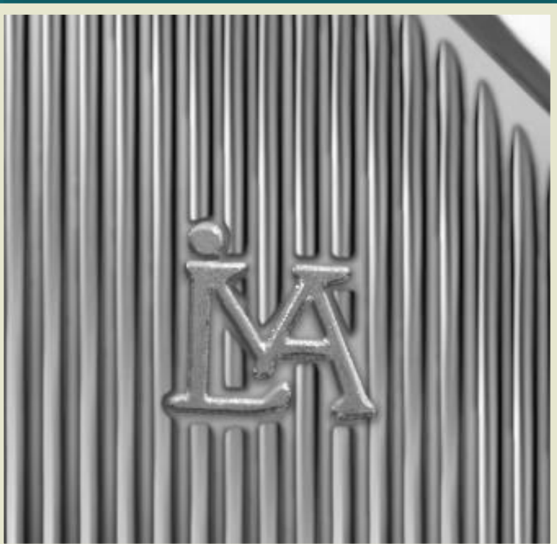
Logotipo de la Casa Nacional de Moneda